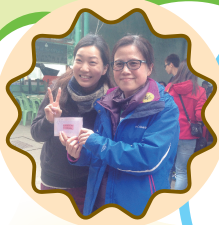
得獎的喜悅已掛在臉上