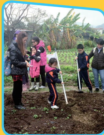
原來鋤頭是這樣重的！ 媽媽，快來幫忙呀！