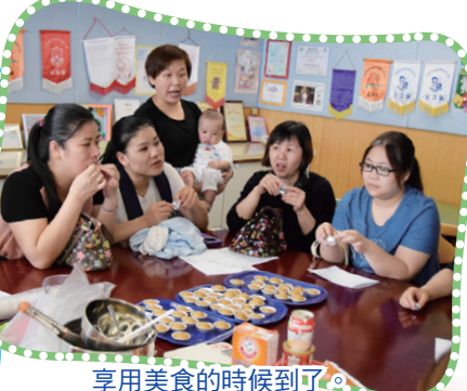
享用美食的時候到了。