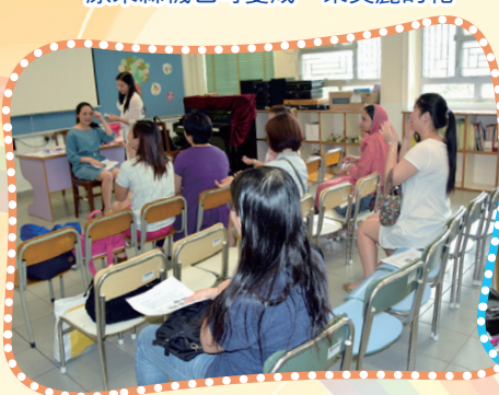
扮靚，扮靚，媽媽都愛扮靚！