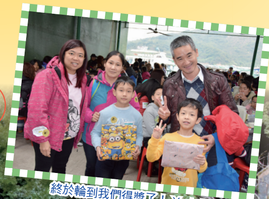
終於輪到我們得獎了！Yeah！