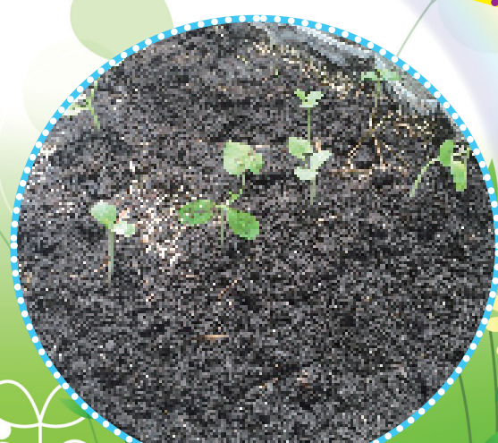
新建園圃內小幼苗開始慢慢成長啦！