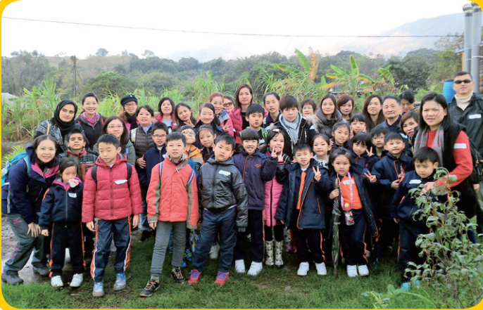
辛勤了半天，大家來拍一張大合照留念。