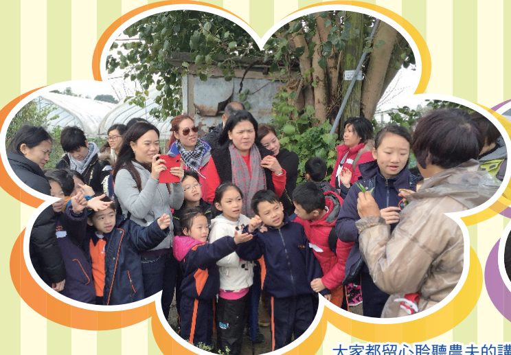
大家都留心聆聽農夫的講解，獲益不少。