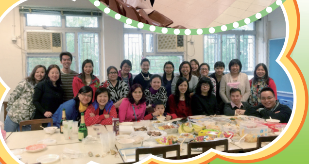
招募學校家長義工暨茶聚日