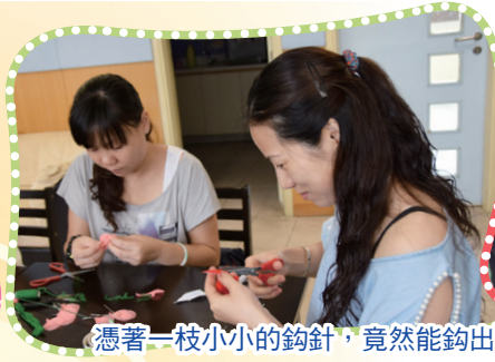
憑著一枝小小的鉤針，竟然能鉤出一隻可愛的兔子，媽媽真厲害呢！