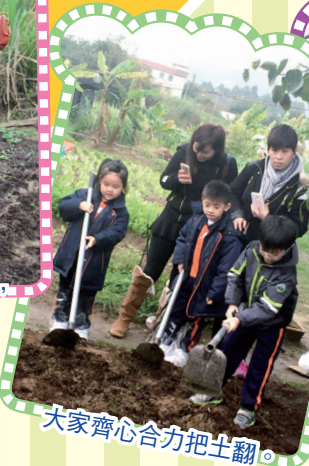
大家齊心合力把土翻。