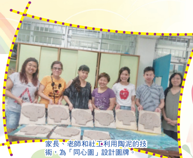
家長、老師和社工利用陶泥的技術，為「同心園」設計園牌。