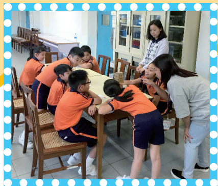
「和諧快線」情緒教育活動