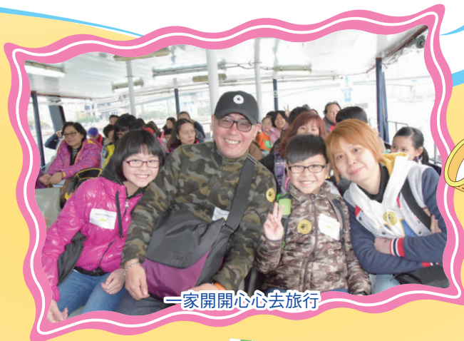
一家開開心心去旅行