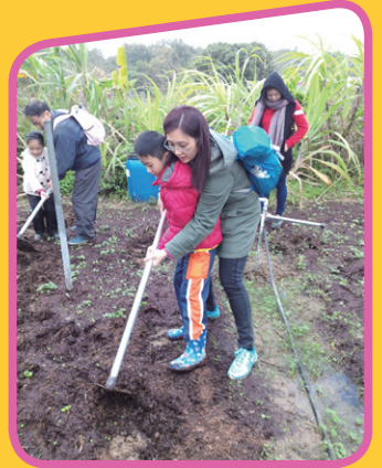
有媽媽的幫忙，輕鬆多了！