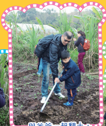
與爸爸一起翻土， 一點也不覺辛苦。