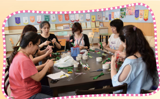
原來絲襪也可變成一朵美麗的花。