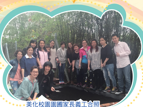
美化校園園圃家長義工合照