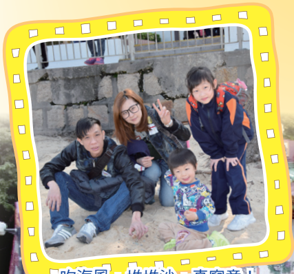
吹海風，堆堆沙，真寫意！