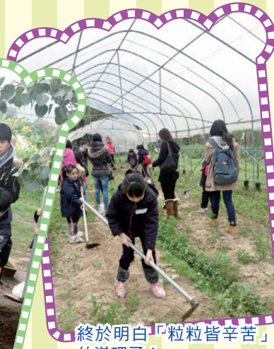
終於明白「粒粒皆辛苦」 的道理了！