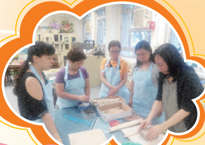
陳老師教導家長搓泥的技巧。

這項比賽，家長和小朋友反應都十分踴躍啊！我們共收到224份參賽作品，而且水準都十分高，所以評審們要從云云參賽作品中確定優勝者，都顯得相當頭痛呢！最後，根據創意、原創性、獨特性、能體現開園目標，以及展現小花園特色各個方面，我們的小花園將稱為「同心園」！讓我們「同心協力」，建設美好的校園吧！