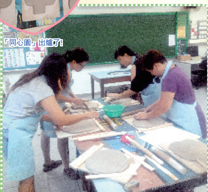
各人出一分力，只希望令「同心園」更完美。