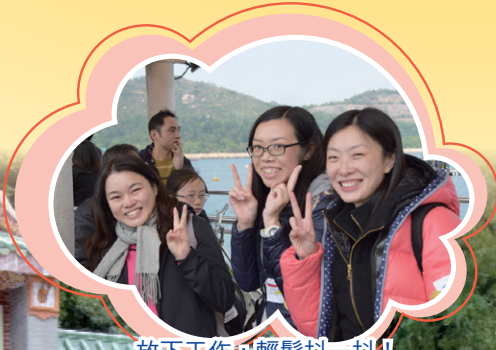
放下工作，輕鬆抖一抖！