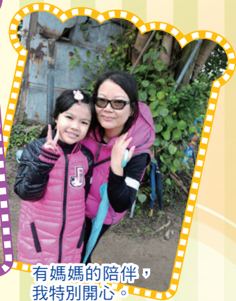
有媽媽的陪伴， 我特別開心。