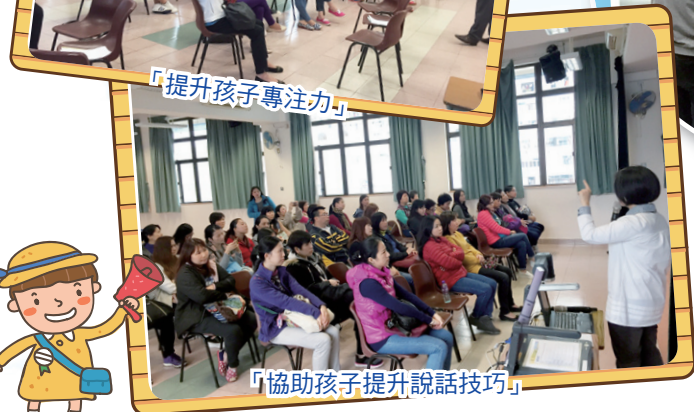
「協助孩子提升說話技巧」